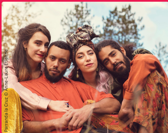
Parranda la Cruz